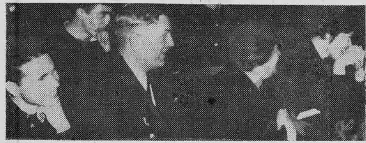
Экзаменатор — зал...

Марьино — это незабываемая память в наших сердцах.