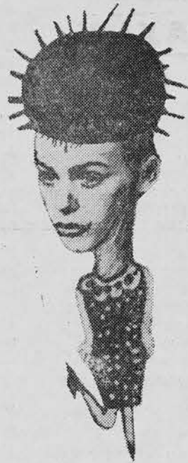
Всем запомнился Еленский. Исполняем роли женской. И поэтому по праву говорим мы:

Следующие два дня свободны. Кто остается, а кто на автобусах — в Москву. Красная площадь, Большой театр, Третьяковка, «Националь» и «Метрополь» (кинотеатр, конечно), — вот далеко не полный перечень мест, где мы были в Москве. Крем-брюлле, сливочный пломбир, эскиммо на палочке, ореховое, с изюмом и без него —