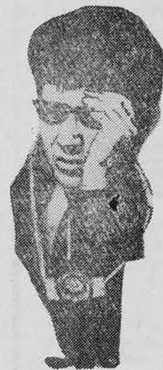
Поработал молодецки. Фотолетописецкий.