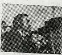
И ТОЛЬКО ПОТОМ ВЫПУСКАЛИ В ЭФИР.