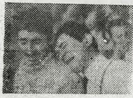
НАС ЗАСТАВЛЯЛИ ПЛАКАТЬ...