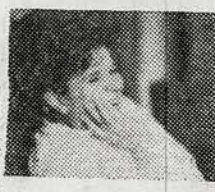
НАД НАМИ СМЕЯЛИСЬ